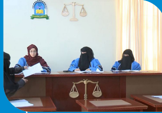
برنامج الشريعة والقانون