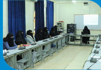
برنامج لغة إنجليزية (ترجمة)