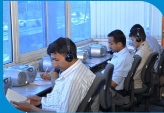
برنامج لغة إنجليزية (لغويات تطبيقية)