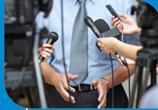
برنامج إعلام (علاقات عامة وإعلان) بكالوريوس