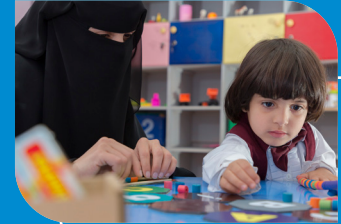
برنامج رياض أطفال