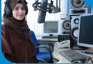
برنامج إعلام (إذاعة وتلفزيون) بكالوريوس