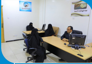
برنامج علم النفس والإرشاد النفسي