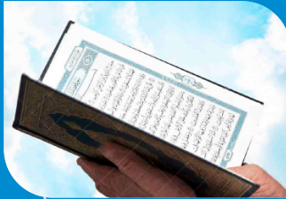
برنامج علوم القرآن